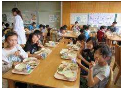
交流給食は楽しいね！

今年度も7月からランチルームを利用した交流給食が始まりました。1年生と6年生、2年生と4年生、3年生と5年生の組み合わせで2クラスの上級生と下級生が同じテーブルで自己紹介などをしながら給食をいただきました。上級生の中には下級生のネームプレートを作ってくれたクラスもあり、交流給食の楽しい時間を過ごすことができました。また一緒に食べたいというリクエストもたくさんありました。