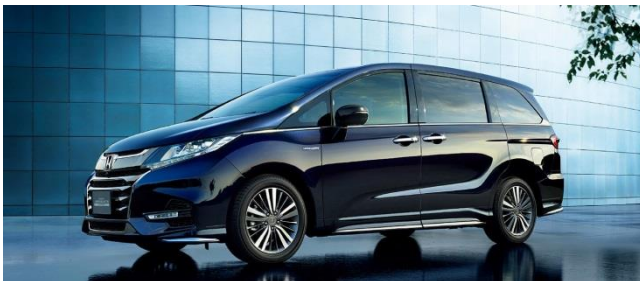
ホンダ埼玉狭山工場（もしくは日産）