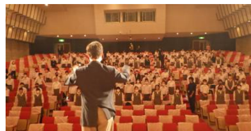
コンクール前の2学年発声練習 席一人分ずつ空けて、マスク着用です。 この後は、立派な演奏が行われました。