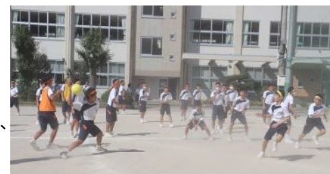
3年生のクラス対抗ドッジボール種目 さすが、3年生。迫力満点です。 終わった後の笑顔が印象的でした。