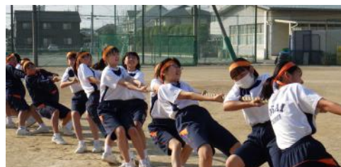
1年生の綱引き。今年は、体育祭の先輩の姿を見られませんでした。それでも一生懸命に取り組みました。

また、合唱コンクールも学年別で教育会館大ホールでの実施でした。学級での練習も制限があり、感染予防に工夫しながら生徒と教員で取り組む姿は目にしていましたが、仕上がり具合や一人一人の成気感はどうかと心配していましたが、当日の各学年の演奏は、そのような心配を見事に吹き飛ばしてくれるものでした。例年に勝るとも劣らない、外部からお呼びした審査員の先生も感激する出来栄でした。ふと、先生方に目を移しますと、そっと目頭を押さえている先生、一心に前を見ながら、足でリズムをとっている先生などの姿が目に入り、心が温まりまたうらやましく感じました。本当に保護者の皆様にご覧いただけなかったことが残念ですが、改めて陽西中学校生の底力を感じ、感動させられました。