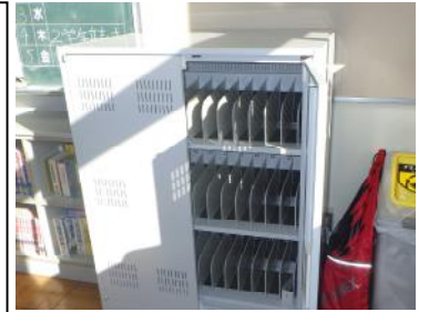
各クラス設置された 電源キャビネット

詳しくは、学校 HP に「宇都宮市 GIGA スクールサイト」を掲載しています。