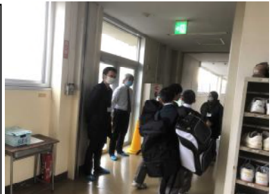
朝サーマルカメラ立哨の様子

朝のサーマルカメラ立哨や放課後の校内消毒では、保護者の皆様方にご協力をいただき、誠にありがとうございます。生徒の健康管理や校内衛生・安全面の確保にご協力いただき、教職員一同、感謝申し上げます。朝、夕のご協力につきましては、何かと慌ただしい時間帯であったり、気温が低い中、お世話になりますが、ご来校の際には、お気をつけてご来校いただきますようお願いいたします。