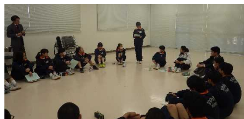
【自信をもって発表する生徒】

2月21日(木)、今年度最後の第7回リーダー研修会を行いました。今までの研修を振り返り、お互いの成果を発表し合う報告会でした。最初は自信がない様子だった生徒も回を重ねるごとに成長が見られ、自分の言葉で意見を発表することができるようになりました。この研修で学んだことを生かして、来年度も様々な活動をより活性化していくことを期待しています。