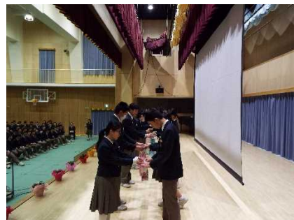
【在校生から卒業生へ】