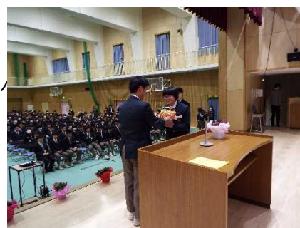
【卒業生から在校生へ】