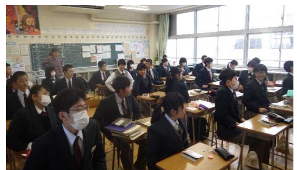
【TV朝会を視聴する生徒】

2月5日(火)朝、保健体育委員が姿勢についての呼びかけを行いました。今回も姿勢をよくするための「市大ストレッチ」の映像に合わせて実践をしました。良い姿勢を心がけることは、集中力を高め、視力低下を防ぎ、正しい骨格を保ち、健康的な生活にもつながります。学習の時だけでなく、普段の生活の中でも正しい姿勢が保たれるように、ご家庭でもご指導をお願いいたします。