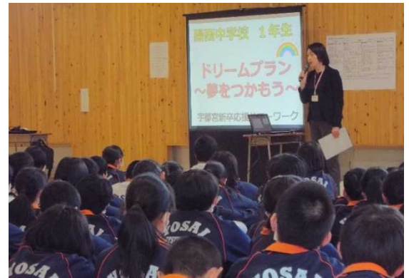
【ハローワークの先生による説明】