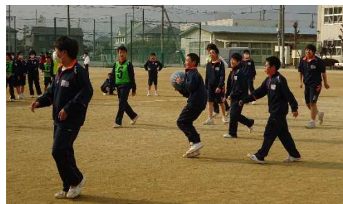
【元気に活動する生徒たち】

2月26日（火）、1学年スポーツフェスティバルを行いました。体力向上とクラスの団結力を深めることを目的に保健体育委員会が企画運営をしました。ドッジボールを行いました。お互いに声をかけ合い、協力してプレーする姿やクラスメートを応援する姿が印象的でした。結果は5組が優勝、2組が準優勝でした。どのクラスも今年度最後の学級対抗に燃えた一日でした。