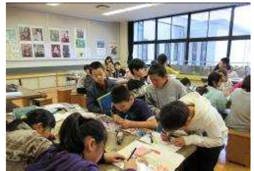
どのクラブも楽しそう・・・。

1月17日(木)3年生のクラブ見学がありました。4年生～6年生がそれぞれ希望するクラブを選択して楽しく活動している様子を、3年生は真剣にメモを取りながら見学していました。クラブ活動の目的は異学年と交流しながら、共通の興味や関心をもつ内容について児童自身が計画を立て、自主的に取り組んでいくことでそれぞれの個性の伸長を図ることです。学校では3年生がこの見学を参考にして、来年1年間楽しく活動できるクラブが選べるよう、支援していきたいと思えます。