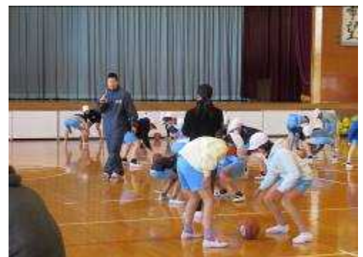
どちらがボールを取れるかな？

1月22日(火)栃木ブレックスの2名のコーチが来校し、5年生を対象に「トップアスリートの技に触れよう、学ぼう」という目的で、走る、飛ぶ、ボール遊び等を通してバスケットボールに親しむキッズモチベーションプロジェクトが開催されました。最後にはゲームもあり、充実した楽しい時間を過ごしました。薄い