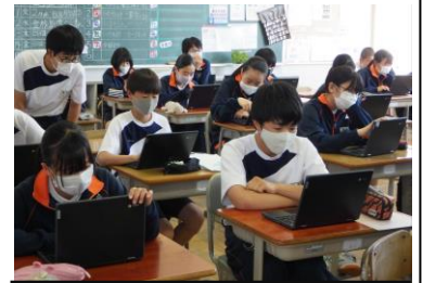
朝読書の時間での端末の練習の様子