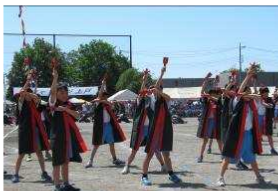
極～きわみ～KAMITO ソーラン（3，4年生）