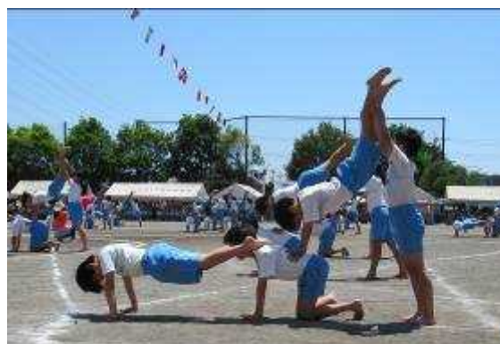
悲しみなんて笑い飛ばせ（5，6年生）