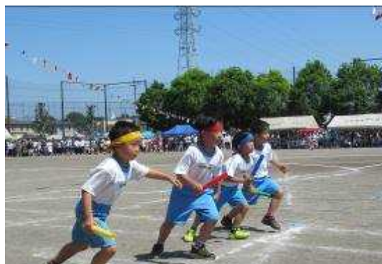
4色対抗リレー（男子）