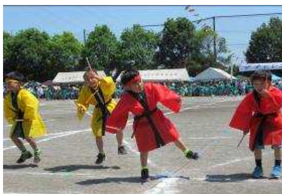
じょんがらまつり（1，2年生）

初めて応援団長になり、不安もあったけれど、外や中で練習していくたびによくなっていく応援団を見ていると、自分も頑張らなきゃという気持ちでいっぱいでした。本番で1年生～6年生みんなで応援していると、一緒に団長の真似をしてくれたり、応援グッズを持って応援してくれたりして、本当にうれしかったです。私が走っている時、1年生や2年生が「赤組団長、頑張れ!」と応援してくれたのは、とてもうれしかったです。結果は残念ながら4位だったし、チャレンジ賞もとれなかったけれど、私の中では赤組の活躍や応援は1位だったと思います。応援を指導してくださった先生方、本当にありがとうございました。