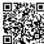
協力店紹介のHPです

年末年始は忘年会や新年会などの宴会が多くなりますが、外食時にも食べ残しを減らすなど、食品ロスの削減へのご協力をお願いいたします。