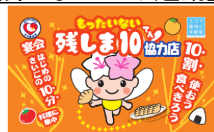
協力店の目印です